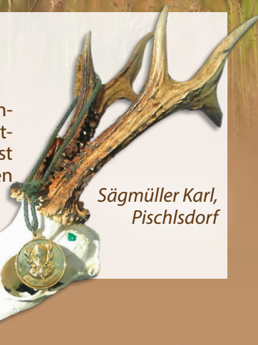
Sägmüller Karl, Pischlsdorf

Die schmackhafte Mineralstoffergänzung für nachhaltige Trophäenbildung. Die Futteraufnahme entspricht der von Getreidemischungen, kein Verlust von hochwertigen Mineralstoffen und Vitaminen durch Futtervergeudung.